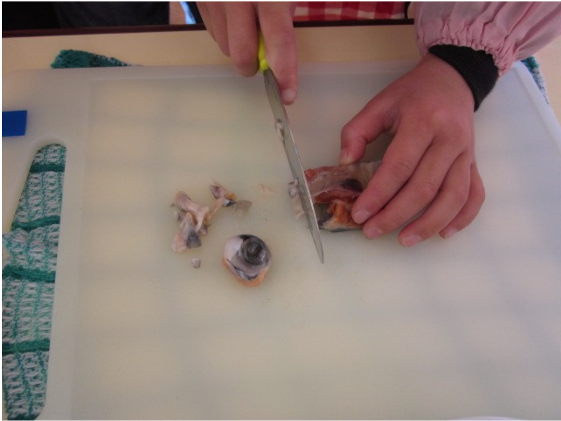
鮭(サケ)の頭を骨ごと食べやすく切りました