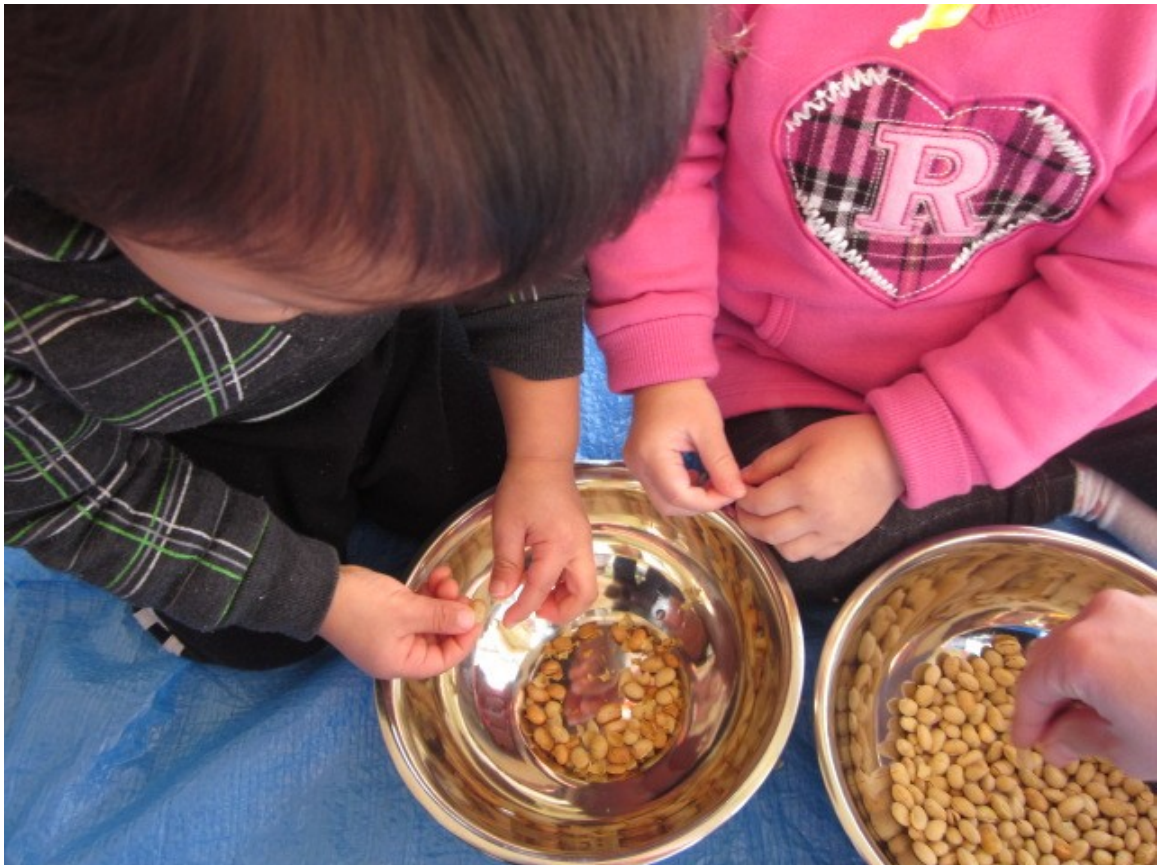
大豆(だいず)の皮をみんなで取りました